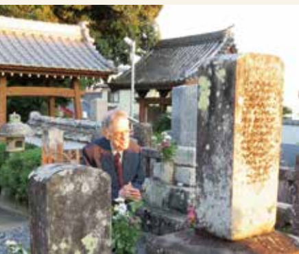
華山の墓を参拝するドナルド・キーン(田原市城宝寺) 2017年10月撮影

日本文化研究の第一人者であり、田原市博物館名誉館長(2017～2019)を務めたドナルド・キーン(1922～2019)は、昨年生誕100年を迎えました。コロンビア大学在学中に、アーサー・ウェーリ訳『源氏物語』に魅了されたキーンは、長い年月をかけて、日本文学や日本文化について研究を積み重ね、多くの著作を残しました。著作の中には、渡辺華山(1793～1841)について書いたものもありました。