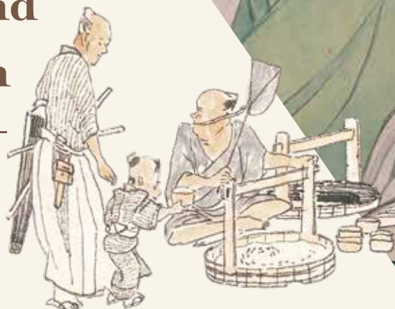
重要文化財 渡辺華山筆「一掃百態図」(部分)より 文政元年(1818) 田原市博物館蔵

Donald Keene and Watanabe Kazan -The Wisdom of Kazan-