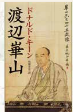
ドナルド・キーン著、角地幸男訳 『渡辺華山』2007年 新潮社

田原市制20周年・田原市博物館開館30年・渡辺華山生誕230年を記念する本展では、日本学者としてのキーンの足跡やその功績、キーンと田原市の交流をたどります。そして著書『渡辺華山』で取り上げた華山の名品を紹介します。