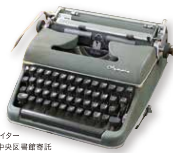
ドナルド・キーン 愛用のタイプライター 東京都北区立中央図書館寄託